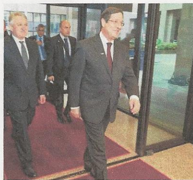
Ο ΠΡΟΕΔΡΟΣ ΣΥΖΗΤΑ ΜΕ ΤΟΥΣ ΥΠΟΥΡΓΟΥΣ ΤΗΝ ΠΟΡΕΙΑ ΕΦΑΡΜΟΓΗΣ ΤΟΥ ΠΡΟΓΡΑΜΜΑΤΟΣ ΤΟΥ ΑΤΥΠΟΥ Υπουργικό Συμβούλιο συγκάλεσε χθες ο Πρόεδρος της Δημοκρατίας για να συζητήσει με τους υπουργούς του την πορεία εφαρμογής του κυβερνητικού προγράμματος. Ο Πρόεδρος ζήτησε να μείνει από τους υπουργούς τις εκκρεμότητες που έχουν σε θέματα των αρμοδιοτήτων τους και για το πώς θα προωθηθούν με την εφαρμογή των σχεδιασμών. Η συζήτηση έγινε με αφορμή τη συμπλήρωση δύο χρόνων από την ανάληψη της διακυβέρνησης της χώρας από τον Πρόεδρο Αναστασιάδη. Ο Πρόεδρος ζήτησε να έχει μια πλήρη εικόνα για μια σειρά από ζητήματα, τα οποία, όπως αναφέρουν συνεργάτες του, βρίσκονται στο προσκήνιο του προγράμματος και ζητά την προώθηση και εφαρμογή τους.

Αναρωτιόμαστε αν η Ελλάδα θα μπορούσε να αποντηθεί από τον Τούρκο Πρωθυπουργό, Ahmet Davutoglu, ο Ομάρ, επιστημονικά τους ισχυρισμούς ότι 16 νησιά στο Άγιο Όρος έχουν καταληφθεί από την Ελλάδα, έφερε: «εσείς ερωτήσατε, ζητώντας να μείνει εάν η Άγκυρα διαβίβαζε την κυριαρχία σε... ελληνικά νησιά.